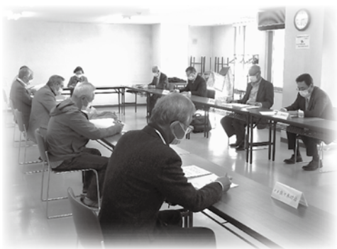
第2回理事会（5月26日）於：余市経済センター