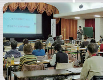
みんなで育てる“おたがいさま”のまち講演会