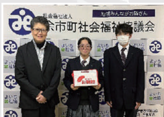
11月7日 余市紅志高等学校

なお、最終結果につきましては社協ホームページや社協だより令和8年5月号等でご報告させていただきます。