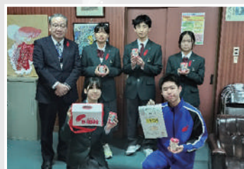
12月4日 余市町立東中学校