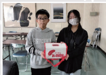
12月1日 余市町立黒川小学校