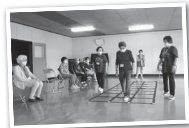
会場／福祉センター入舟分館

ふまねっと運動は、体の機能を向上させるためだけでなく、運動を通じて地域とのつながりや絆を深め、毎日の生活をゆたかにすることができるよう「交流」の要素を重視しています。